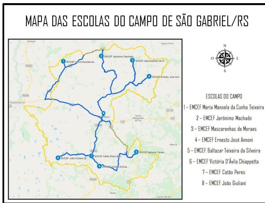
Figura 1 – Mapas das Escolas do Campo de São Gabriel/RS

Além disso, as 8 Escolas Municipais do Campo localizam-se nos extremos sul e norte da área territorial do município, conforme apresentado na Figura 1, o que gera a necessidade da utilização do transporte escolar pelas comunidades rurais no deslocamento até as instituições de ensino (exceto a EMCEF João Giuliani, que localiza-se dentro da Fazenda Formosa e atende exclusivamente filhos dos trabalhadores da empresa).